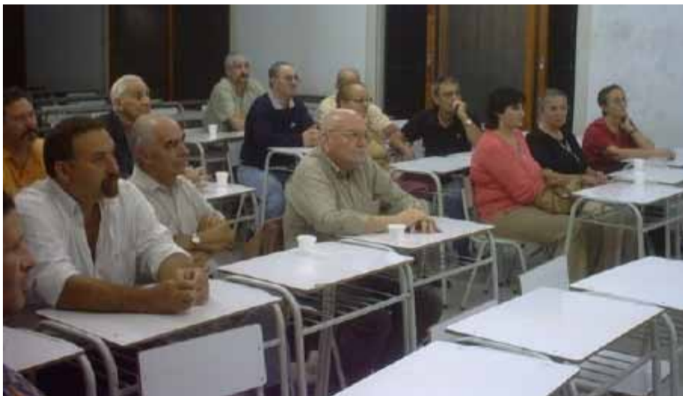
Imagen de los concurrentes a aquella reunión fundacional del Centro Lucano.

brando la semillita para que prenda en las nuevas generaciones.