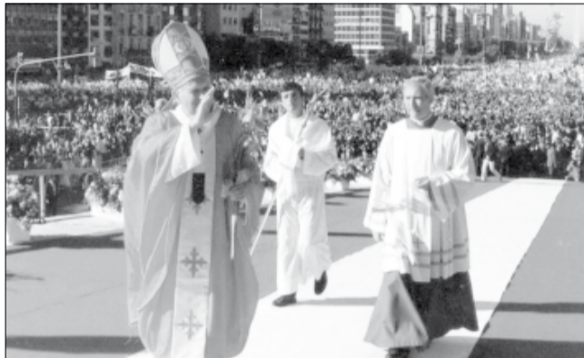
Juan Pablo II en Buenos Aires, en 1987

1483 – nació el pintor renacentista italiano Raffaello Sanzio "Rafael". Murió este mismo día, de 1520. 1520 – Rafael muere el día de su 37º cumpleaños. 1671 - nació el escritor francés Jean-Baptiste Rousseau. 1830 – Joseph Smith funda en Nueva York la Iglesia de Jesucristo de los Santos del Ultimo Día, más conocida como Iglesia mormona. 1852 – Buenos Aires, Entre Ríos, Corrientes y Santa Fe firman el Protocolo de Palermo. 1892 – nace Donald Wills Douglas, pionero de la aviación. 1896 – apertura de los primeros Juegos Olímpicos modernos en Grecia. 1906 – se registra el primer dibujo animado. 1909 – los exploradores estadounidenses Robert Peary y Matthew Henson son los primeros hombres en llegar al Polo Norte. 1917 – Primera Guerra Mundial: el Congreso de los Estados Unidos aprueba la declaración de guerra a Alemania. 1926 – parten de Seattle, EE.UU., 4 aviones Douglas para emprender la primera vuelta al mundo en